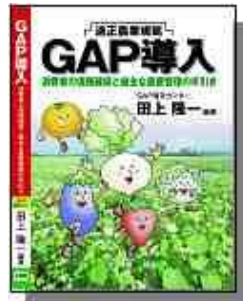
GAP シリーズ 2