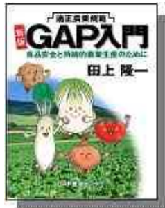
GAP シリーズ 1